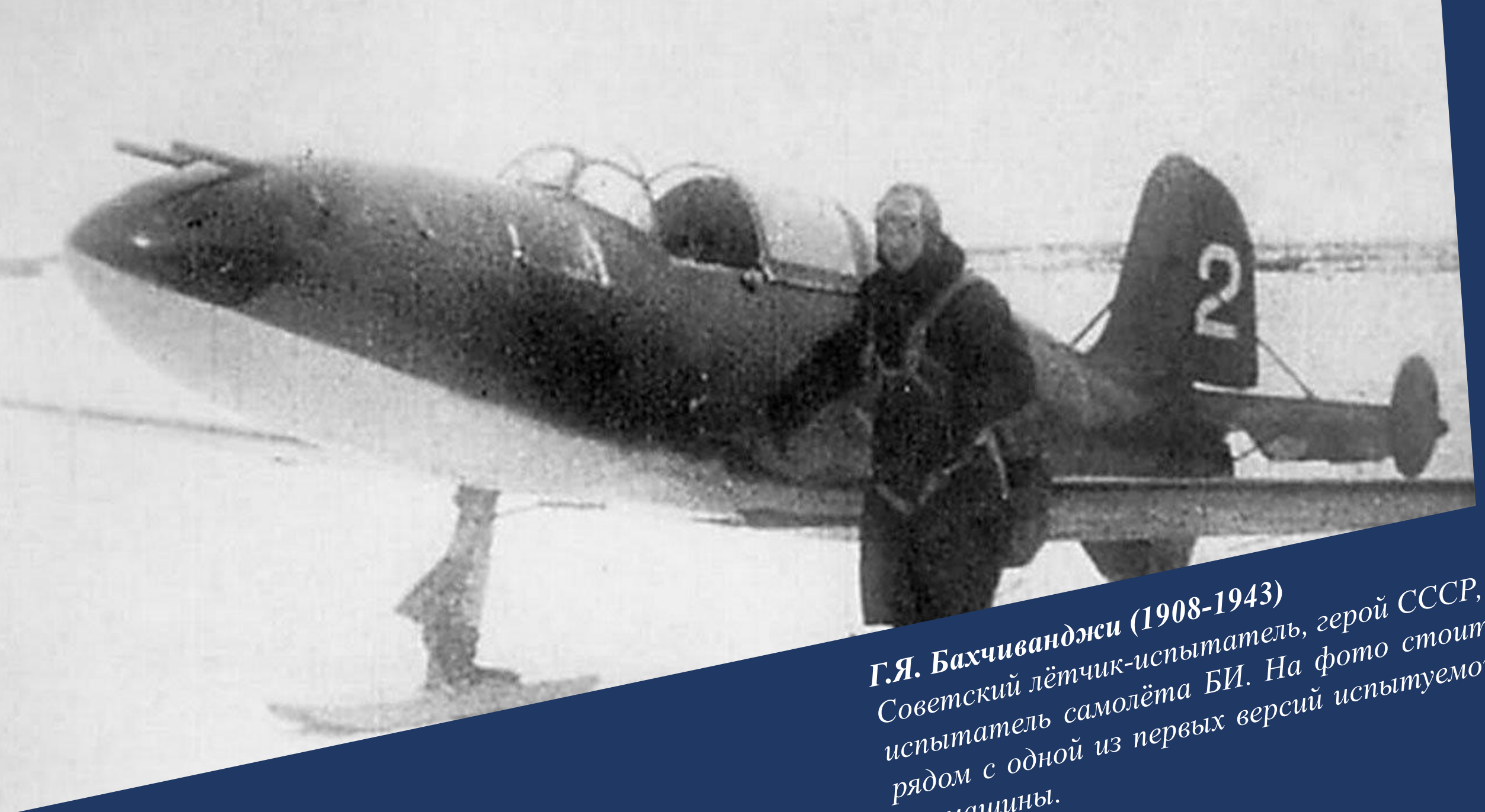
Г.Я. Бахчиванджи (1908-1943) Советский лётчик-испытатель, герой СССР, испытатель самолёта БИ. На фото стоит рядом с одной из первых версий испытуемой им машины.