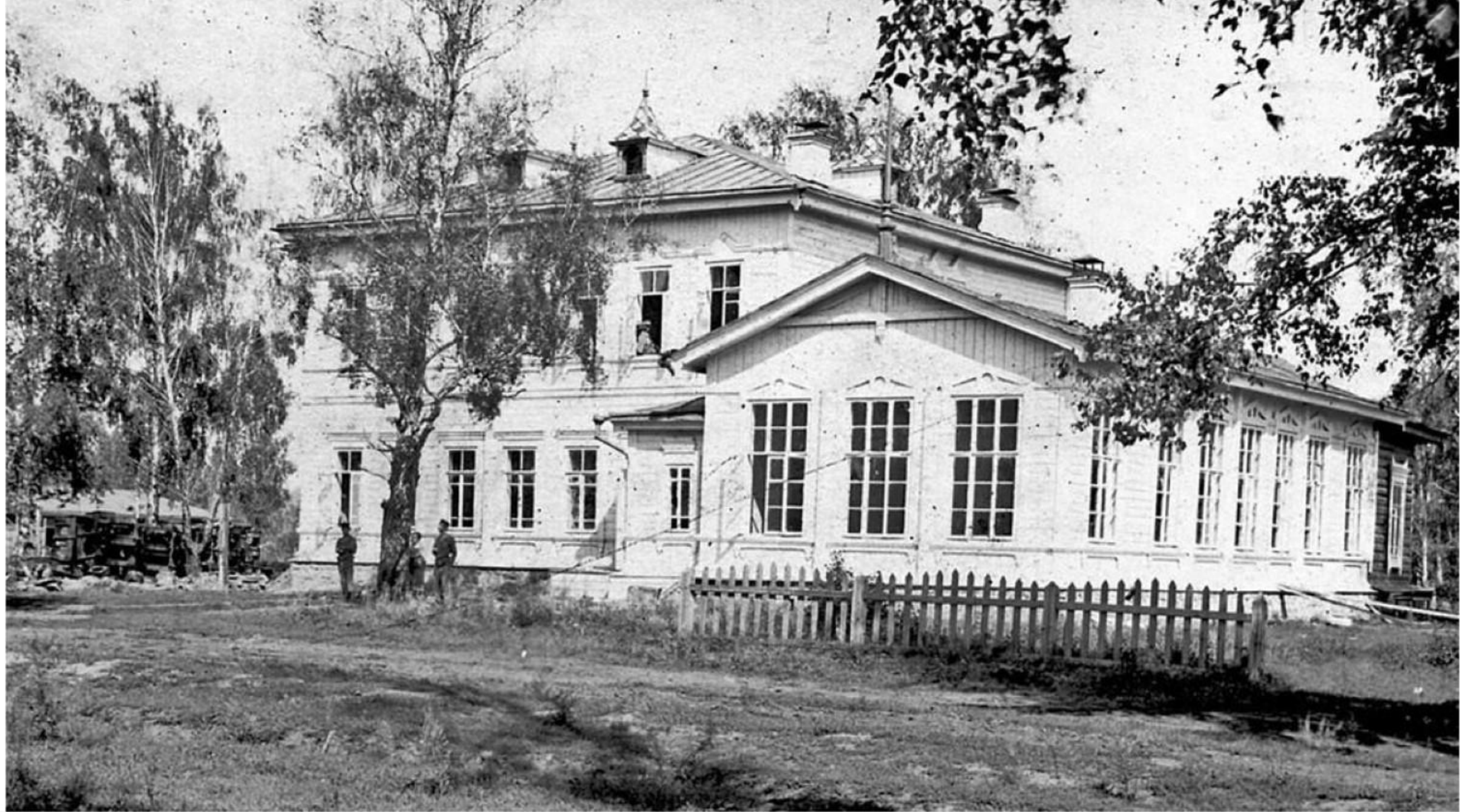
Иланская начальная школа