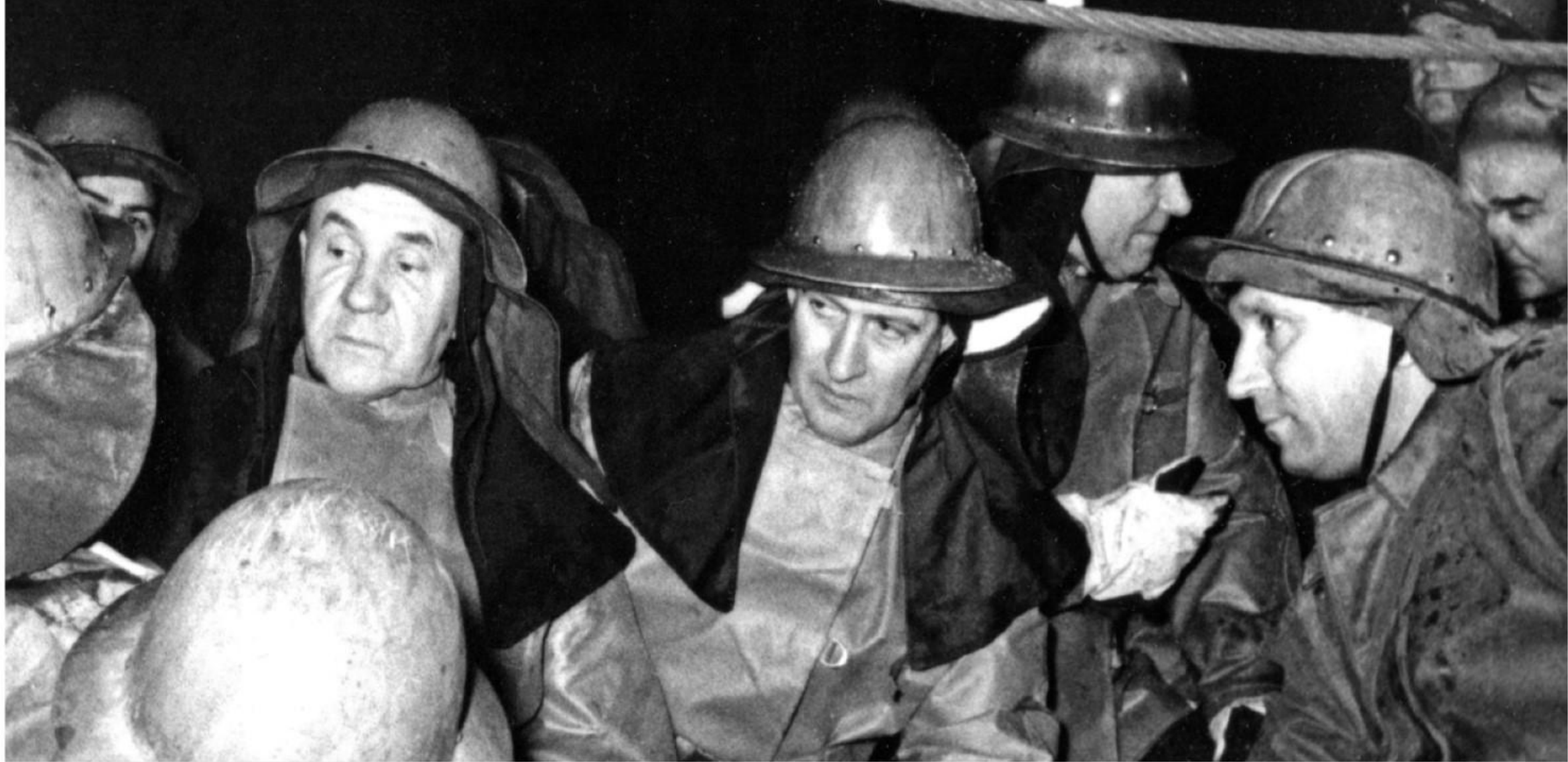
Владимир Иванович Долгих и Председатель Совета Министров СССР Алексей Николаевич Косыгин на первом талнахском руднике «Маяк».