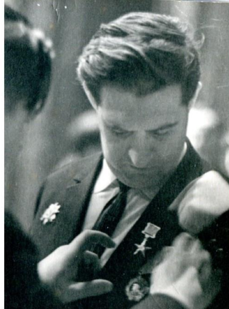
Присвоение звания Героя Социалистического Труда с вручением золотой медали «Серп и Молот». 1965 год.