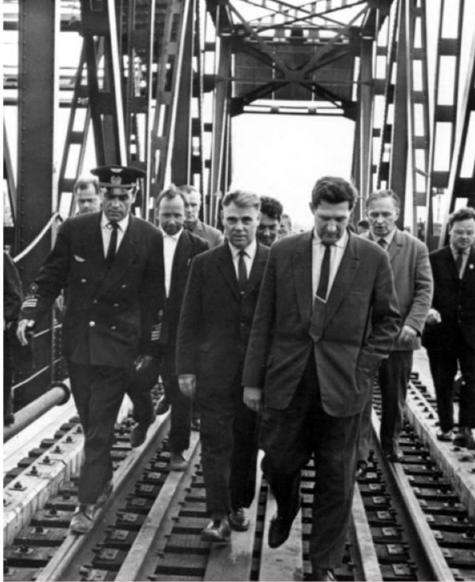
В. И. Долгих осматривает новый мост через реку Норилку. 1965 год