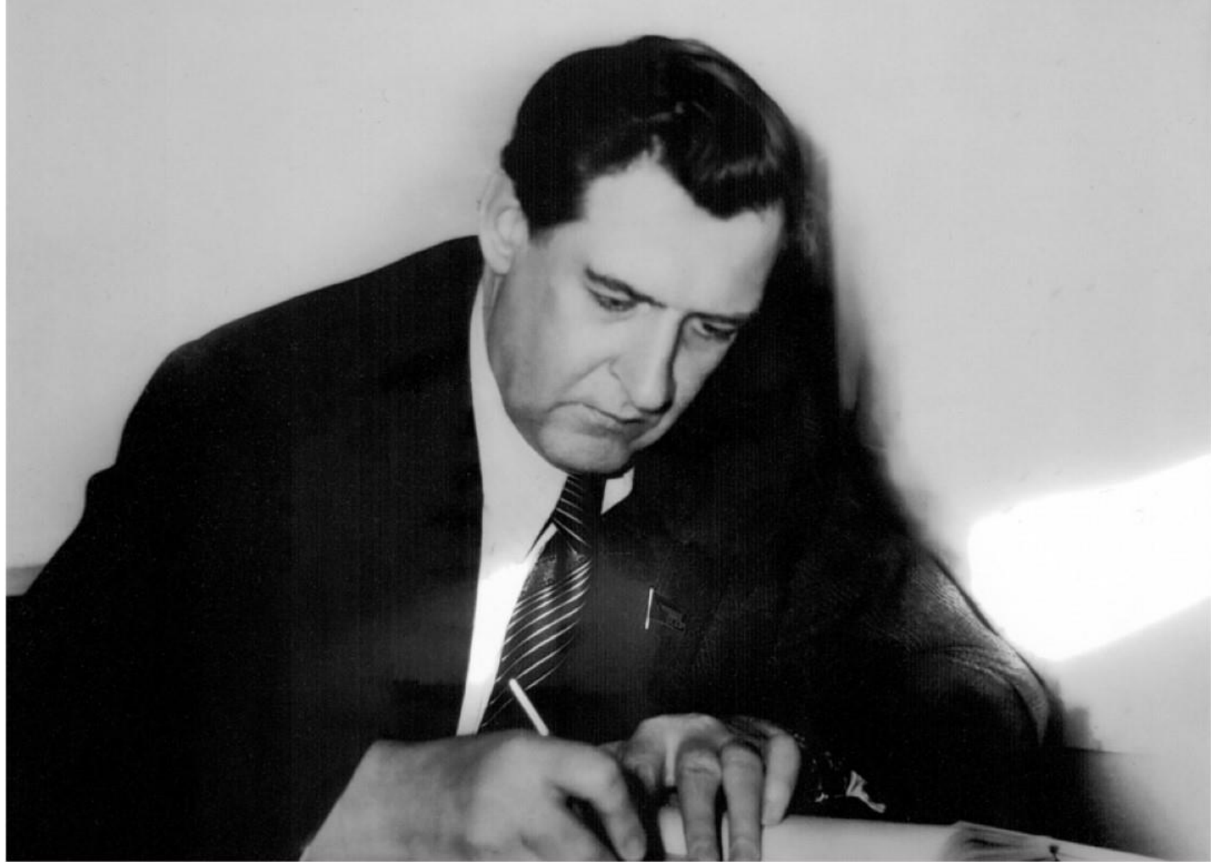
В. И. Долгих. Директор Норильского горно-металлургического комбината.