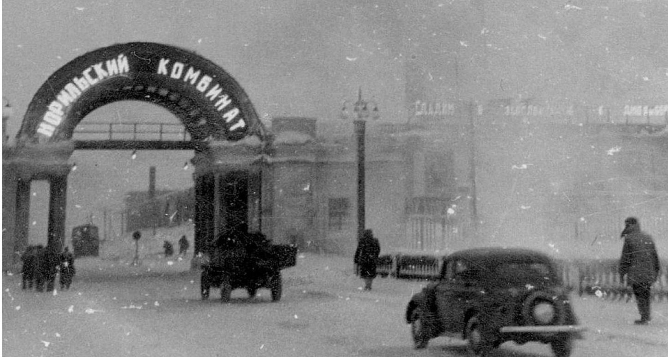
Въезд на территорию Норильского горно-металлургического комбината. 1960-е годы.