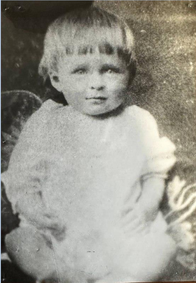
Володе 3 года