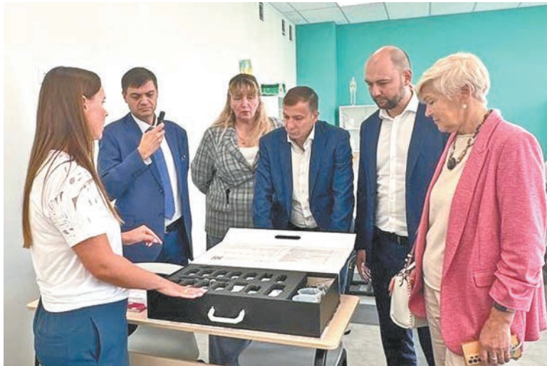
ный корпус школы № 460 имени дважды Героев Советского Союза