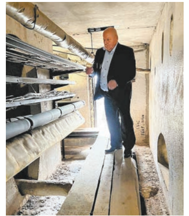
В остальном качество работ удовлетворительное.

На одной из заменённых труб при осмотре было обнаружено расхождение теплоизоляции. Исполнитель согласился с данным замечанием, которое было оперативно устранено.