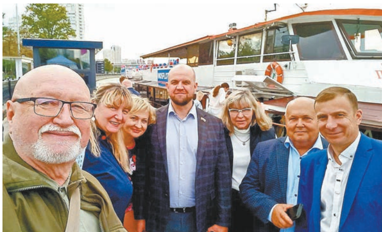
теплом и уютом, а живописные пейзажи столицы добавляли красоту этому вечеру. Участники делились впечатлениями, заводили новые знакомства и просто наслаждались

временем, проведённым вместе, что сделало это мероприятие поистине запоминающимся.