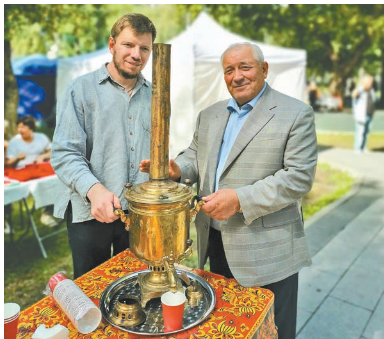
Материалы третьей полосы подготовила Мария МОНАХОВА

Фестиваль народной культуры вновь доказал, что исконные традиции – не просто история. Народные традиции живы и пользуются огромной любовью. Фестиваль стал ярким событием, завершившим лето и подарившим всем участникам праздника заряд добра и единства. До новых встреч!