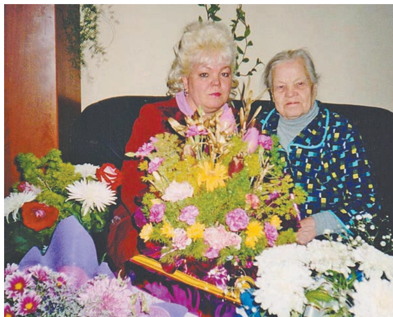
В мамин день рождения.

На этот раз, в ноябре текущего года, в Москве проводится региональный этап конкурса «Рабочая честь России». Главная цель конкурса – повышение престижа рабочих профессий и содействие в решении дефицита кадров. Заявку на участие в кон-